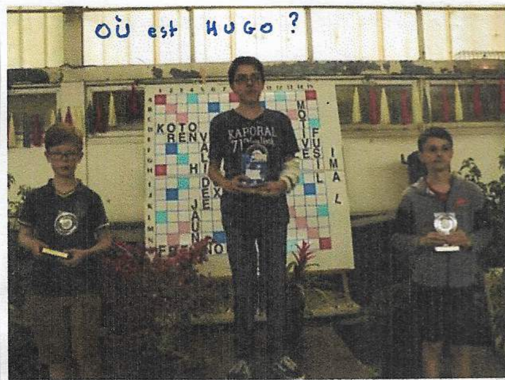
"TOP 3 PLANETAIRE !" 2019